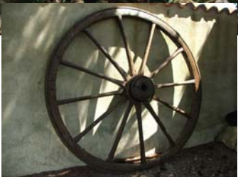
Belle La Croix