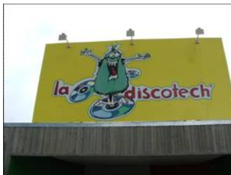
Loisirs autour de La Croix