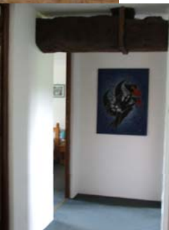
Conforts à La Croix