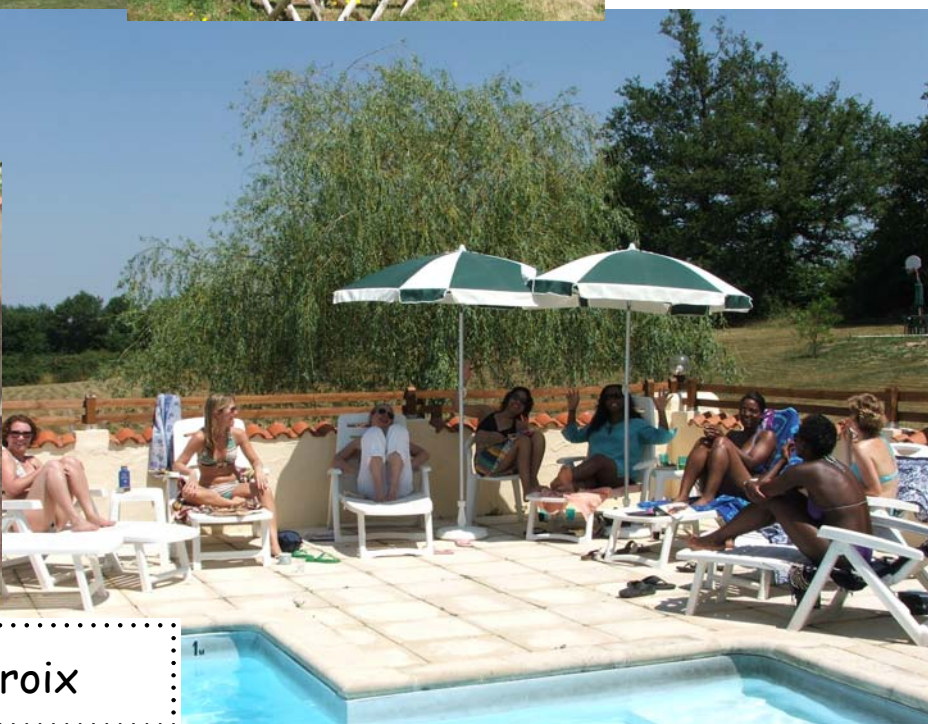
Réspirez à La Croix